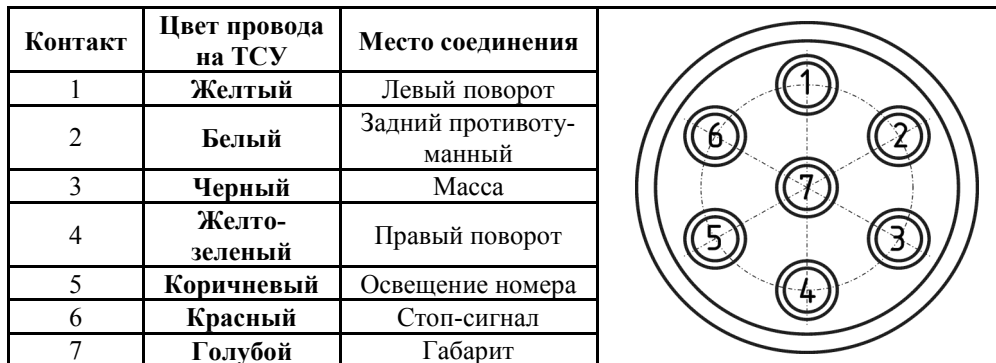
СХЕМА МОНТАЖА ТСУ