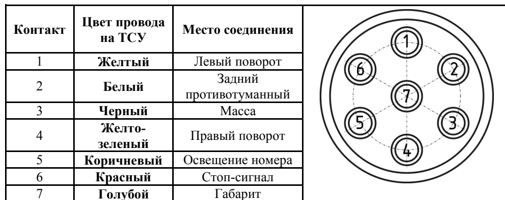
СХЕМА МОНТАЖА ТСУ