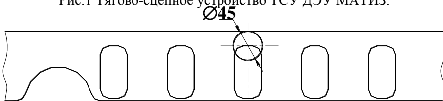
Рис.2 Нижняя часть заднего бампера.